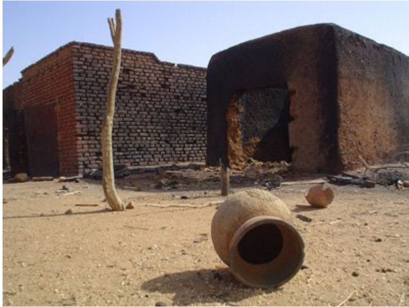
BO: Die joernalis se werk kan hom na die mees ongewone plekke bring. Hier is winkels wat deur brandstigting verwoes is op 'n dorpie in die oorlogsgeteisterde Darfur*) in Wes-Soedan, Afrika.