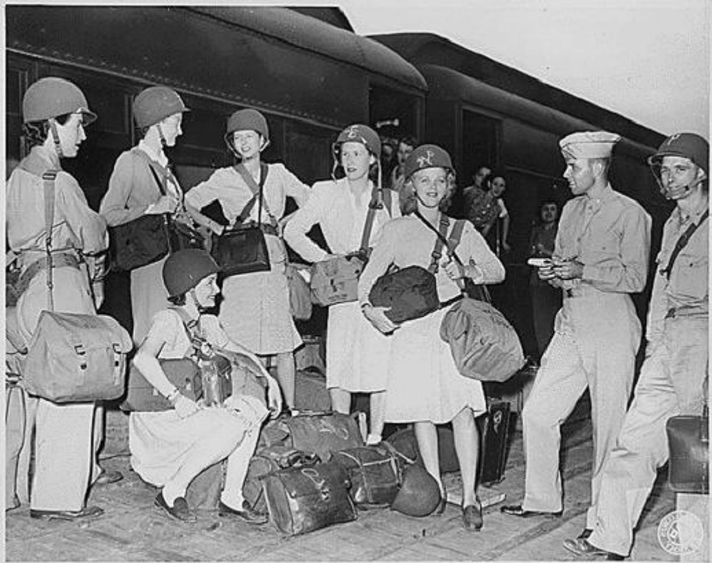
BO: Die joernalistiek as beroep is al sou oud as koerante—of baie ouer nog, afhangende van hoe 'n mens dit definieer. Hier is 'n foto van Amerikaanse oorlogskorrespondente, saam met lede van die destydse intelligensiediens van die VSA, wat in die Tweede Wêreldoorlog op die punt staan om oorsee te vertrek, bes moontlik na sekere brandpunte van die oorlog.